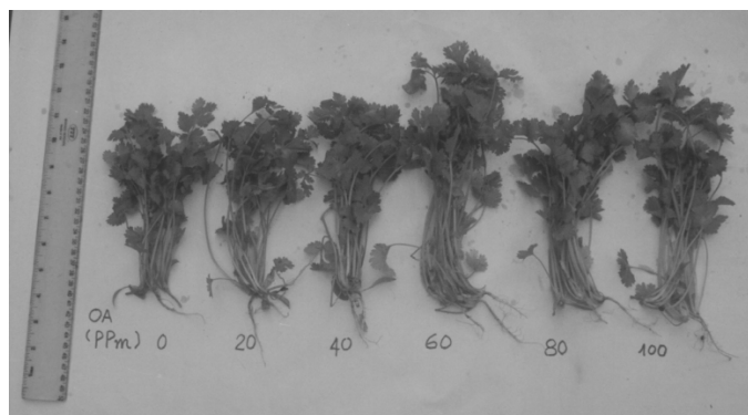
Hình 2: Cây ngò (25 ngày tuổi) sau khi xử lý OA ở các nồng độ khác nhau

Thí nghiệm chứng tỏ OA có tác động kích thích sự tăng trưởng, làm tăng sinh khối, tăng khả năng tích lũy chất khô và kết quả là làm tăng đáng kể sản lượng thu hoạch của ngò.