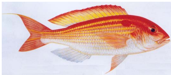
Hình 1: Cá Lượng Nhật - Nemipterus japonicus (Bloch, 1791)

mẻ lưới (bình quân là 1,7%) và chiếm 7 - 15% trong nhóm cá làm thực phẩm - “cá giết” - (bình quân 10%), chủ yếu là cá Lượng Đuôi Ngắn ( N. metopias ), cá Lượng Vây Đuôi Dài ( N. virgatus ), cá Lượng Sáu Răng ( N. hexodon ). Còn cá Lượng Nhật chiếm khoảng 0,3% tổng sản lượng trong các mẻ lưới kéo đáy, 3% trong nhóm cá làm thực phẩm và 18% sản lượng họ cá Lượng [3].